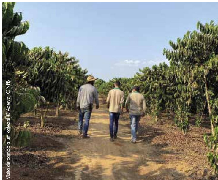
Visita de campo a um cafezal