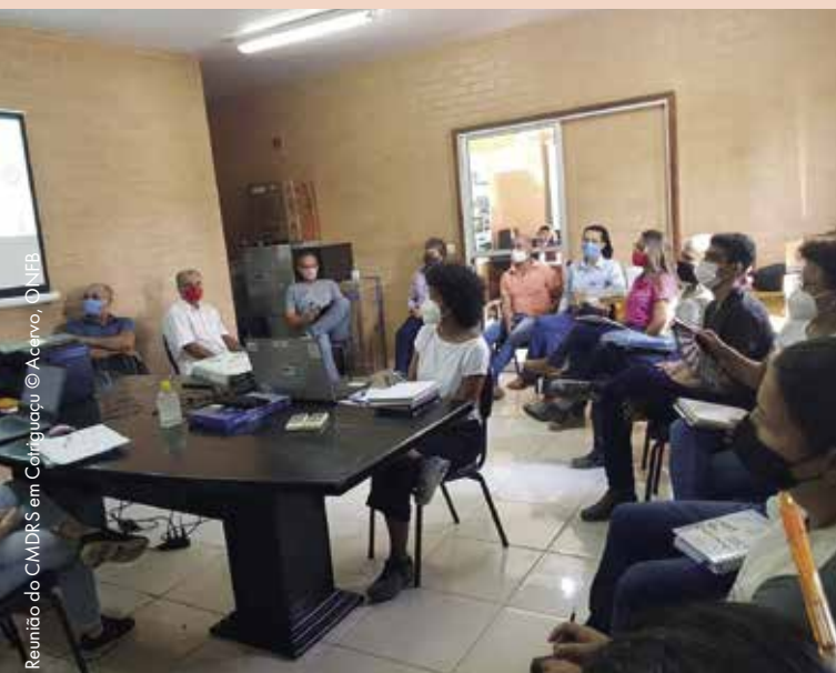
Reunião do CMDRS em Cotriguaçu

TerrAmaz-Cotriguaçu acompanha o município na implementação de sua estratégia de transição territorial e no monitoramento dos seus resultados.