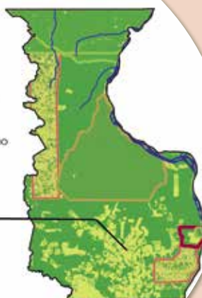
Mapa Cotriguaçu © C. Vautin, Cirad