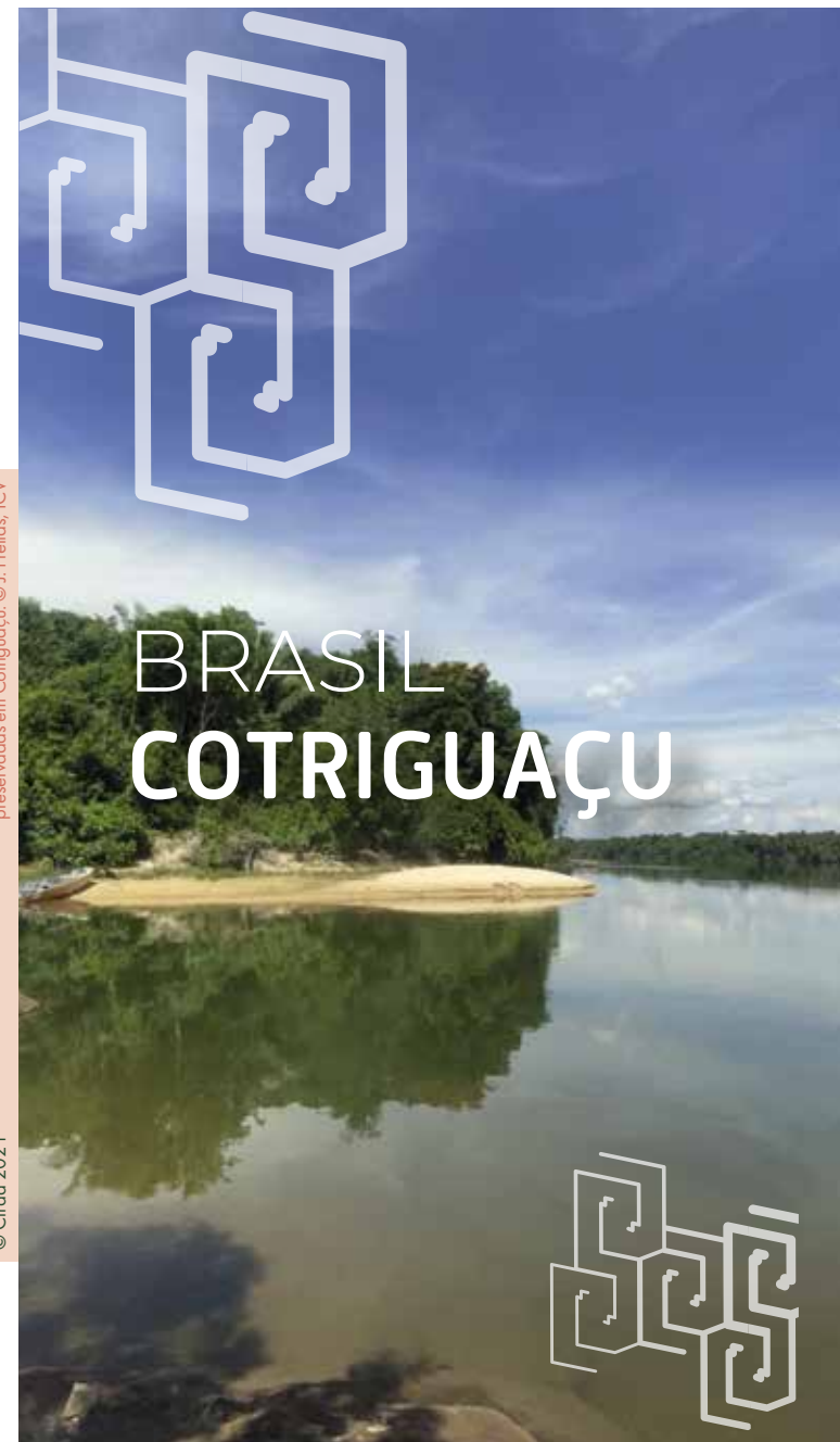
Foto de capa - Beleza cênica do Rio Juruena e suas margens preservadas em Cotriguaçu.