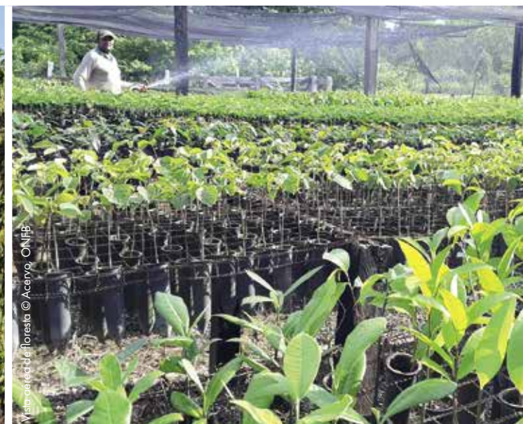
Visita técnica à floresta