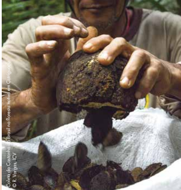
Coleta da Castanha do Brasil na floresta nativa em Cotriguaçu